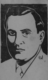
DR. CALDERON GUARDIA

Personas que fácilmente previenen los acontecimientos después de sucedidos, afirman que debieron tomarse de antemano precauciones para reprimir el pillaje, como si este fuera cosa común en las costumbres de los costarricense. En los períodos de mas exaltada lucha política, cuando las pasiones están al rojo blanco, se realizan desfiles de grandes multitudes, sin que nunca haya habido que deplorar escenas como las del sábado. El día primero